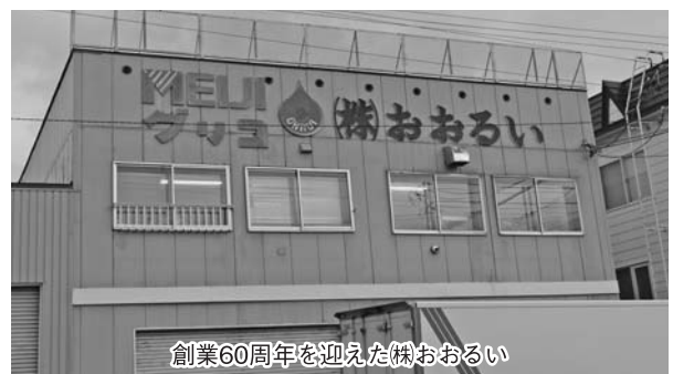
創業60周年を迎えた(株)おおるい

最後に「先代が残した会社をもっと大きく、そして長く続けられるように努力していきたい。また、これからも地元に寄り添い続けて仕事をしていきたい。」と、話して下さいました。