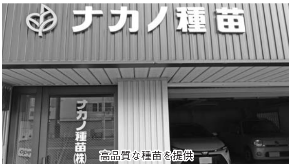
高品質な種苗を提供

「農家の経営の方向性までも左右する大切な仕事。提供した種苗が無事に育ち出荷できた時の、農家の笑顔に力を頂いている」と話して下さいました。