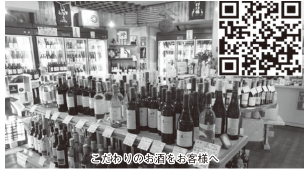
こだわりのお酒をお客様へ

季節によって店頭にも並ぶ商品が変わるので、是非足を運んでみてはいかがでしょうか。下記QRコードからお店の情報をご覧くださいませ。